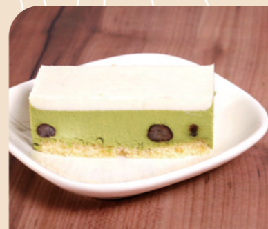
味の素 フリーカットケーキ レア抹茶

かご豆入りの香り豊かな抹茶のムースと、ミルク風味のナバーシュを組み合わせた、レアタイプの和風ケーキです。