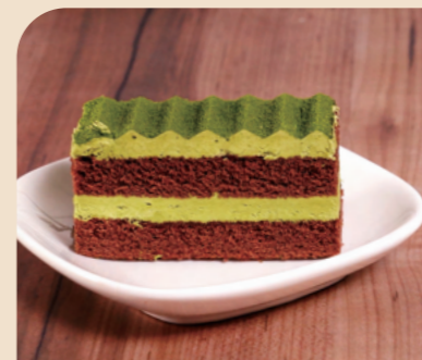
味の素 フリーカットケーキ 抹茶

「春」の季節におすすめの彩デザート厳選しました。 季節メニューにいかがでしょう。