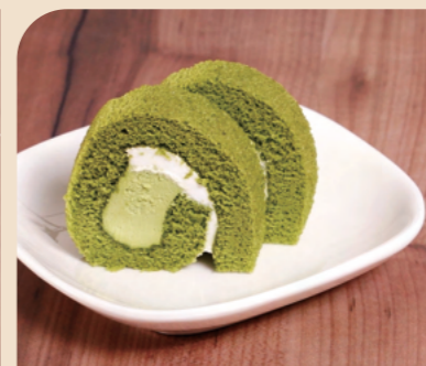
JG 20カットロール 宇治抹茶

色鮮やかな抹茶スポンジで、抹茶クリームとミルククリームを巻きました。抹茶のほろ苦さと、ミルククリームの優しい甘さが特徴の商品です。