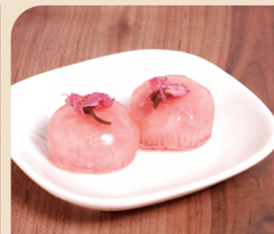
北九食品 さくらさくら

くず餅の上に塩漬けた桜の花を飾りました。桜餅とは違った形で春を感じていただける華やかな商品です。