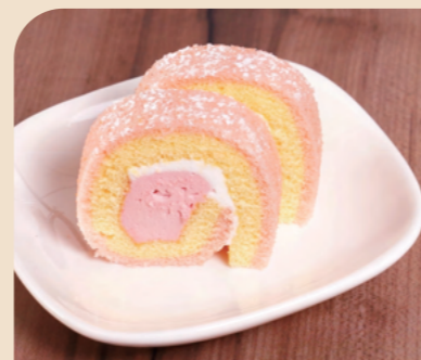
JG 20カットロール いちご

いちごの香りと北海道産れん乳を使ったコクがあるクリームを、ピンクと黄色の2層スポンジで巻いた可愛い見た目のロールケーキです。