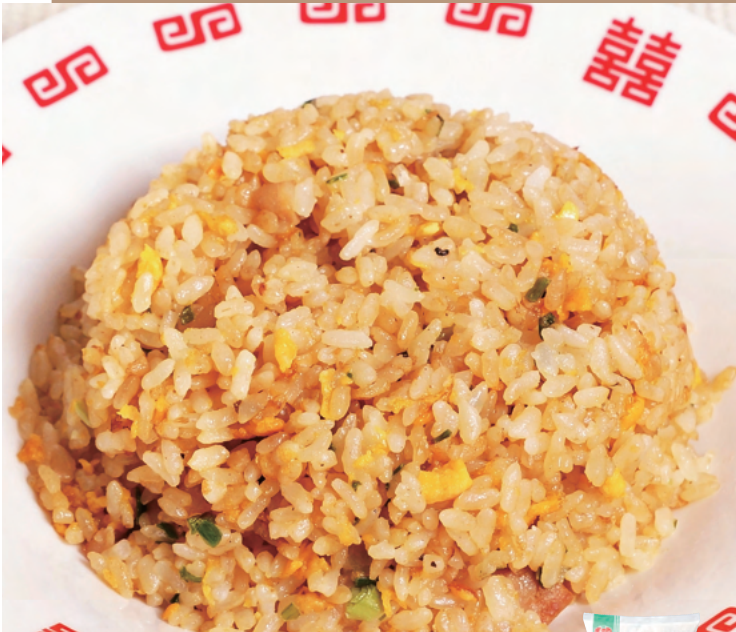
JFSA NEW 本格あおり炒めチャーハン

あおり炒め製法で仕上げた、醤油の香ばしさとニンニクの風味が感じられるチャーハンです。