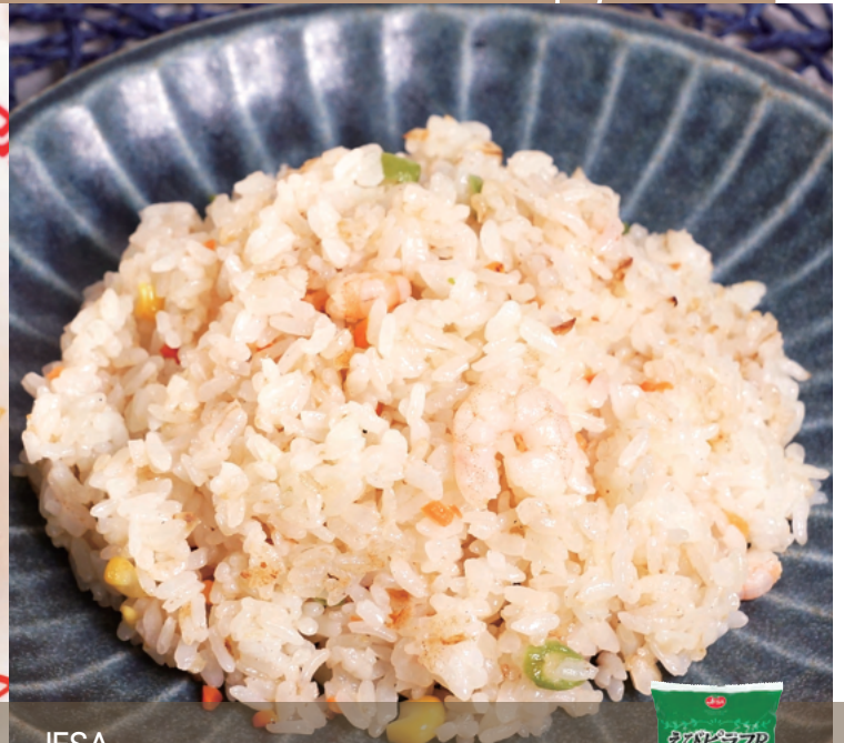
JFSA えびピラフ R