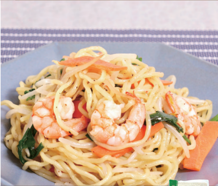
JFSA 塩焼きそば(具なし)

アクセントに黒胡椒を効かせた塩焼きそばです。お好みの具材と合わせてご使用ください。