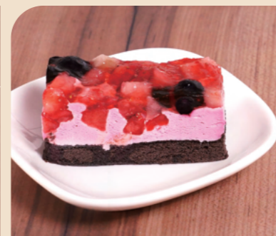
味の素 フリーカットケーキ ダブルベリー

栃木県産とちおとめ苺果汁を使用し、いちごとブルーベリーの果肉を贅沢に敷き詰めた、彩り鮮やかなフルーツケーキです。