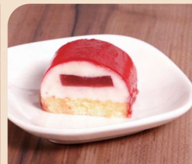
味の素 フリーカットケーキ ドーム・オ・フランボワ

フランボワーズの鮮やかな酸味と甘み特徴です。美しいドーム型のデザインで、見た目にも華やかなイベントにぴったりの一品です。