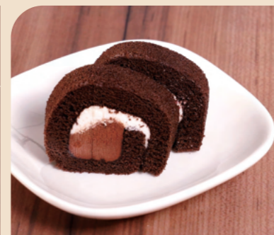
JG 20カットロール Wチョコ

ビターなチョコクリームと、やさしい甘さのホワイトチョコクリームを巻いた2種の異なるチョコレートクリームが特徴のロールケーキです。