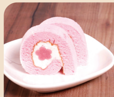
JG 20カットロール 桜

ピンク色の生地で花型の桜あん、桜クリームを巻いた、春にぴったりの彩り鮮やかなロールケーキです。 ※季節限定商品。