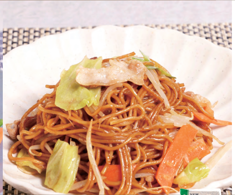
JFSA NEW ソース焼きそば(具なし)

オリジナル麺を使用した香ばしいソース焼きそばです。お好みの具材と合わせてご使用ください。