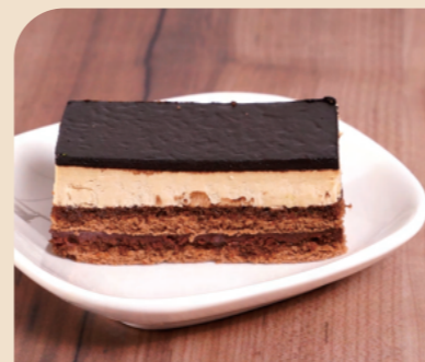
味の素 フリーカットケーキ オペラ

コーヒーシロップを染みこませた生地、ガナッシュやコーヒークリームを重ねました。濃厚な口どけが特徴の高級感のある商品です。